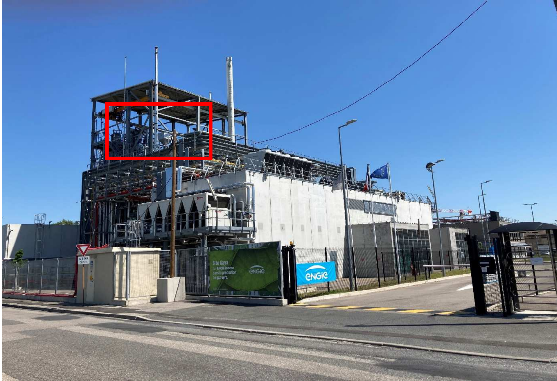
Figure 1 : prise de vue de la plateforme vue de l'extérieur, c'est-à-dire depuis le Quai Louis Aulagne. L'encadré rouge indique la zone dans laquelle les travaux seront réalisés

Photographies datées de la zone d'implantation, avec une localisation cartographique des prises de vue, l'une devant permettre de situer le projet dans l'environnement proche et l'autre de le situer dans le paysage lointain ;