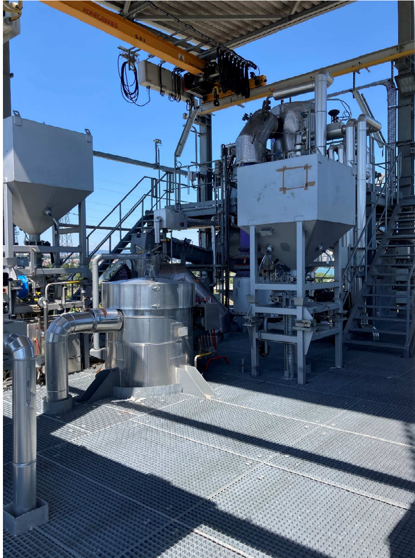
Figure 5 : autre angle de vue de l'avant-dernier étage de la plateforme où les travaux précités seront réalisés