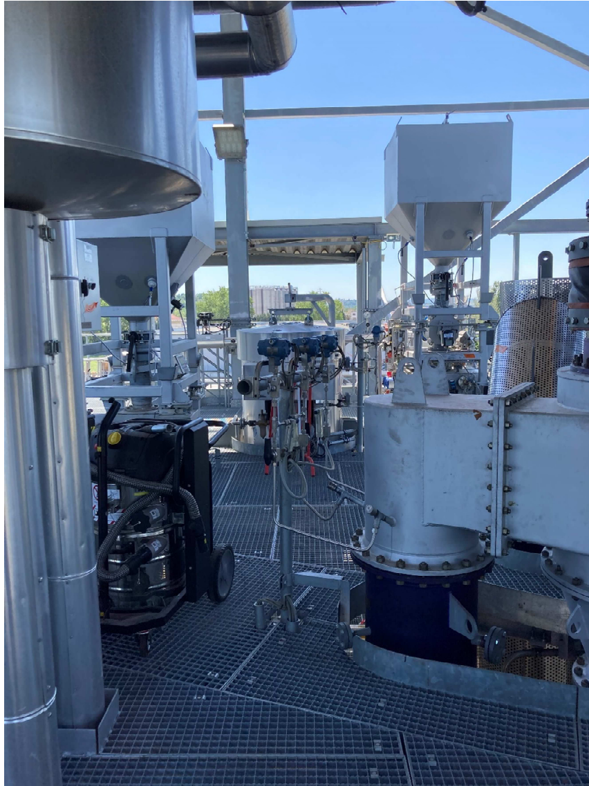
Figure 4 : vue de l'avant-dernier étage de la plateforme où les travaux de modification de la ligne de traitement des fumées et de la ligne syngaz seront réalisés