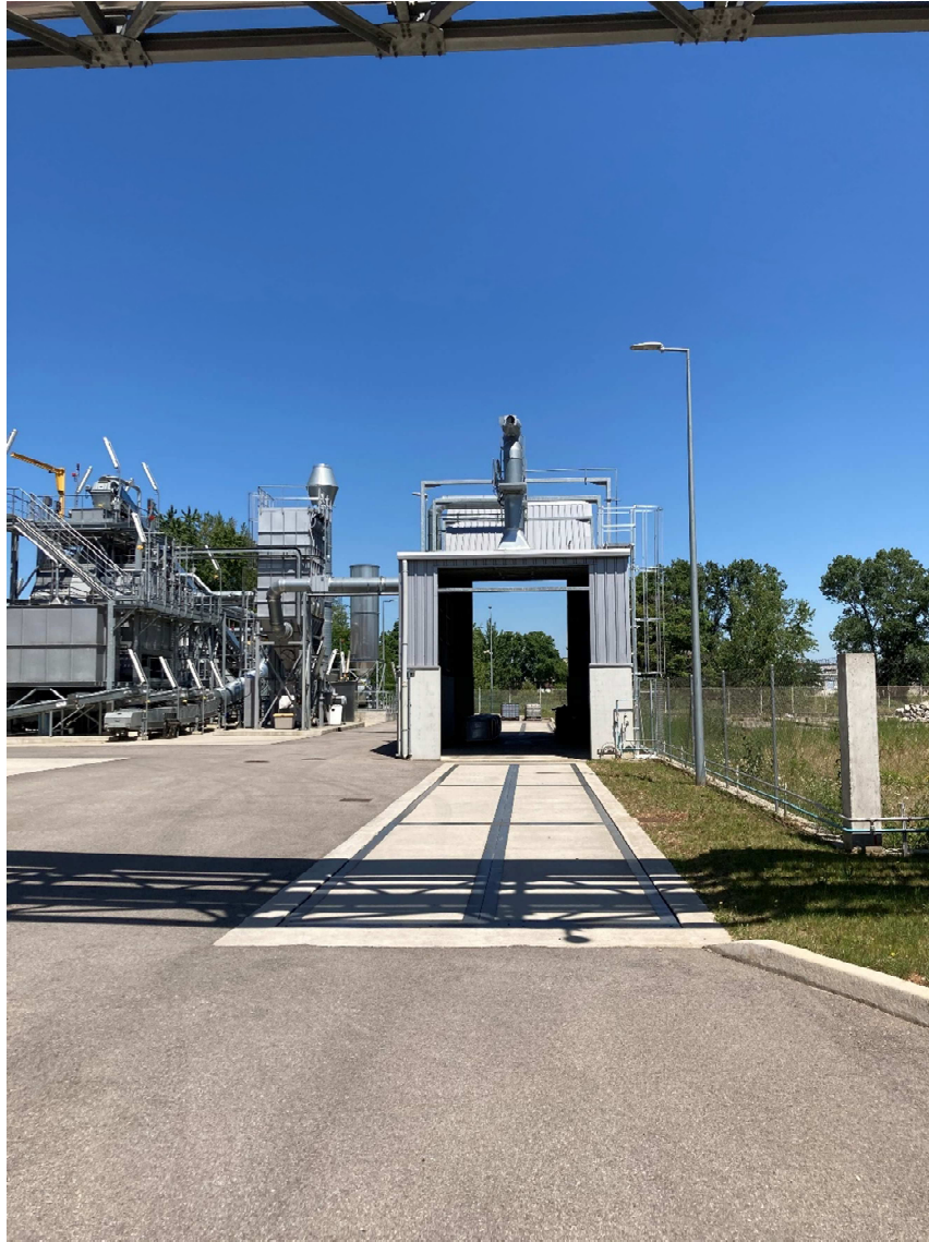
Figure 2 : zone d'arrivée des camions approvisionnant la plateforme en intrants. Le même trajet est utilisé pour un approvisionnement en bois non traité et CSR / bois B